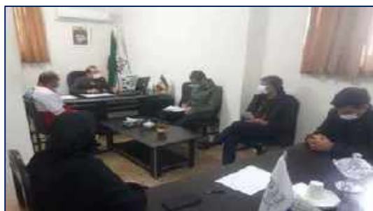
جلسه هماهنگی به منظور ادامه روند طرح شهید حاج قاسم سلیمانی و افزایش پوشش واکسیناسیون در شهرستان آرادان ۱۴۰۰/۱۰/۱۴