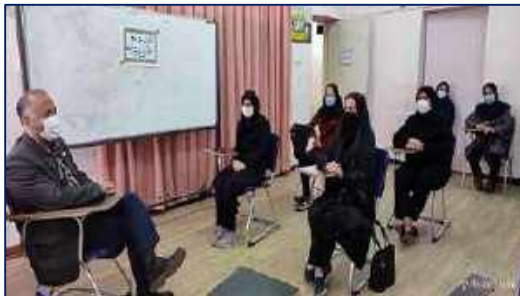
برگزاری مراسم آغاز بیست و هفتمین دوره ی آموزش فراگیران بهورزی در مرکز بهداشت شهرستان سمنان ۱۴۰۰/۱۰/۱۱