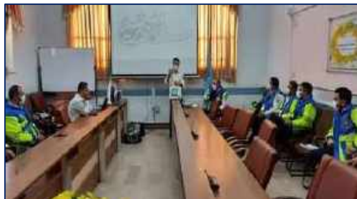
برگزاری کارگاه آموزش رانندگی تدافعی، شناخت و اصول کار با تجهیزات آمبولانس برای نیروهای عملیاتی اورژانس پیش بیمارستانی شهرستان گرمسار ۱۴۰۰/۱۰/۰۵