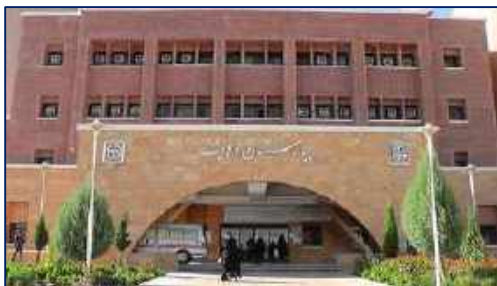
قدردانی بیمار ترخیصی از بیمارستان ولایت از خدمات مطلوب و ارزنده کادر درمان این بیمارستان ۱۴۰۰/۱۰/۲۹