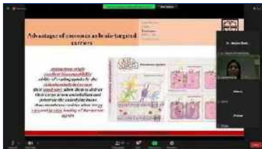
دهمین کنگره علوم اعصاب پایه و بالینی با همکاری دانشگاه علوم پزشکی استان سمنان برگزار شد ۱۴۰۰/۱۰/۰۵