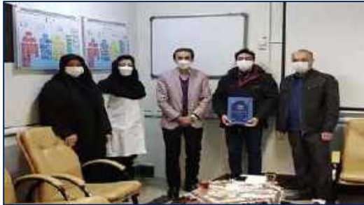
مراسم تکریم از مسئول سابق روابط عمومی مرکز آموزشی، پژوهشی و درمانی کوثر ۱۴۰۰/۱۰/۰۹