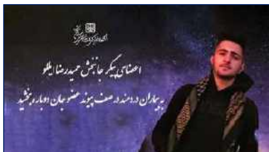
اهدای عضو، امتداد زندگی ... ۱۴۰۰/۱۰/۱۸