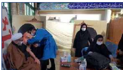
گزارش حضور تیم های واکسیناسیون در جمع نمازگزاران در مصلاهی نماز جمعه ۱۴۰۰/۱۰/۱۹