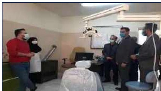
بازدید سرپرست فرمانداری شهرستان آرادان از شبکه بهداشت و درمان این شهرستان ۱۴۰۰/۱۰/۲۶