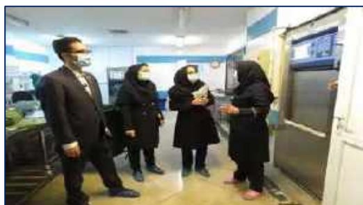
بازدید مدیر پرستاری دانشگاه از واحد استریلیزاسیون مرکز آموزشی پژوهشی و درمانی کوثر سمنان ۱۴۰۰/۱۰/۱۳