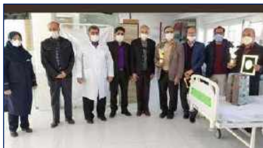
اهداء سه دستگاه دیالیز به بخش دیالیز مرکز آموزشی، پژوهشی و درمانی کوثر ۱۴۰۰/۱۰/۰۷