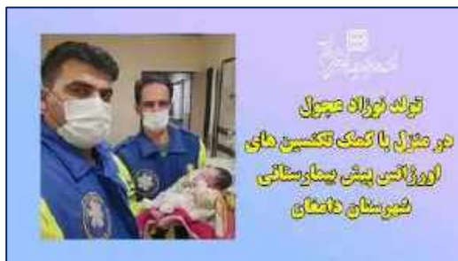
تولد نوزاد پسر در منزل با کمک تکنسین های اورژانس پیش بیمارستانی شهرستان دامغان ۱۴۰۰/۱۰/۰۴