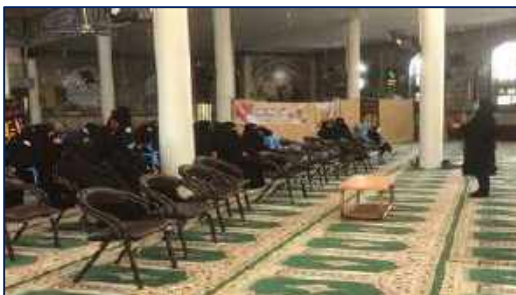
حضور کارشناسان شبکه بهداشت و درمان شهرستان سرخه در حسینیه شهدا ۱۴۰۰/۱۰/۱۵