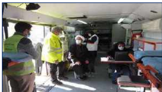
فعالیت مستمر اکیپ سیار واکسیناسیون کووید-۱۹ مرکز بهداشت شهرستان سمنان ۱۴۰۰/۱۰/۱۸