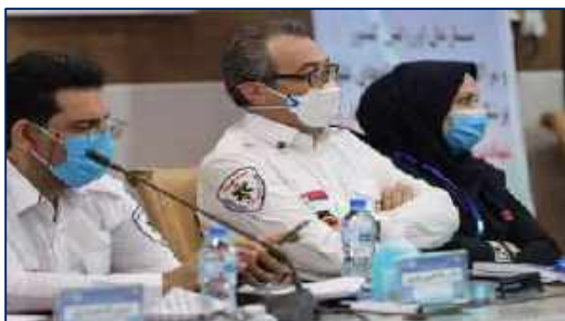
سرپرست اورژانس پیش بیمارستانی و مدیریت حوادث دانشگاه در سی و پنجمین همایش روسای مراکز سازمان اورژانس کشور ۱۴۰۰/۱۰/۱۲