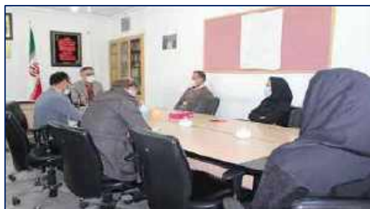
سی و هفتمین جلسه هماهنگی پیشگیری و مقابله با کرونا ویروس و کمیته اجرایی واکسیناسیون کووید ۱۹ (گام ششم طرح شهید سلیمانی) در شبکه بهداشت و درمان دامغان ۱۴۰۰/۱۰/۱۹