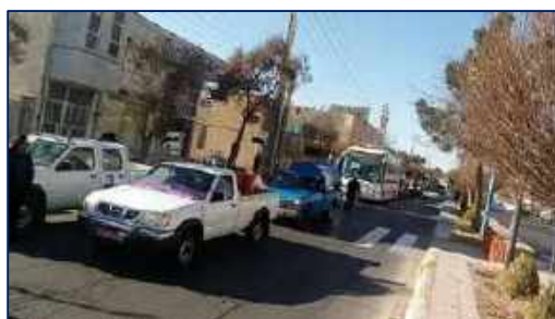
برگزاری مانور موتوروی روز ایمنی در برابر زلزله و کاهش اثرات بلایای طبیعی در شهر سمنان ۱۴۰۰/۱۰/۰۸