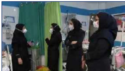
پایان ارزیابی اعتباربخشی در مرکز آموزشی، پژوهشی و درمانی کوثر ۱۴۰۰/۱۰/۲۸