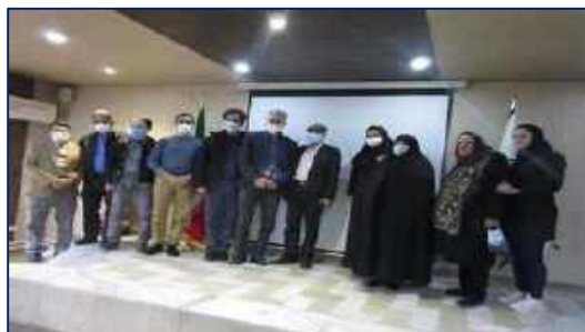
در مراسمی، از زحمات جمعی از بازنشستگان مرکز بهداشت سمنان قدردانی شد ۱۴۰۰/۱۰/۲۵