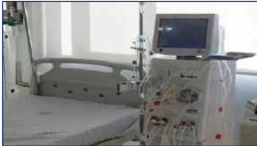
انجام فرایند درمانی دیالیز برای کودکان در بخش همودیالیز بیمارستان کوثر سمنان ۱۴۰۰/۱۰/۲۸