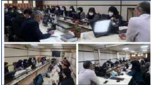
حضور معاون تحقیقات و فناوری و سرپرست معاونت آموزشی دانشگاه در دانشکده توانبخشی ۱۴۰۰/۱۰/۰۵