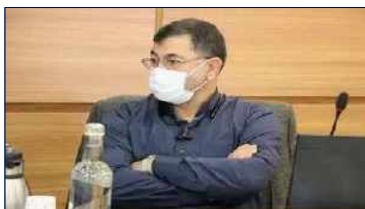
مدیر امور حقوقی دانشگاه به عنوان دبیر کارگروه علمی و ارزیابی عملکرد مدیریت های حقوقی منطقه یک کشور منصوب شد ۱۴۰۰/۱۰/۲۸