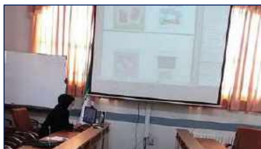
وبینار آموزشی مهارت های فرزند پروری در شبکه بهداشت و درمان شهرستان گرمسار برگزار شد ۱۴۰۰/۱۰/۲۹