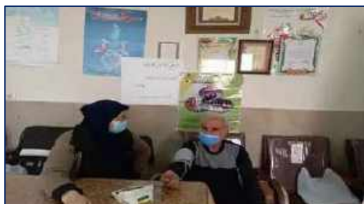
اجرای برنامه مراقبت سالمندان در کانون بازنشستگان شبکه بهداشت و درمان دامغان ۱۴۰۰/۱۰/۱۳