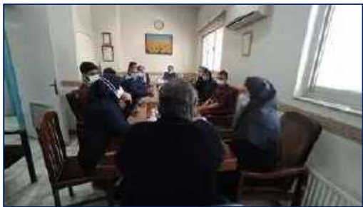
قدردانی سرپرست بیمارستان امیرالمومنین (ع) از پرسنل تلاشگر برای جابه جایی بخش اورژانس اطفال ۱۴۰۰/۱۰/۲۸