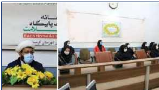
نشست بصیرتی در شبکه بهداشت و درمان شهرستان گرمسار برگزار شد ۱۴۰۰/۱۰/۱۱