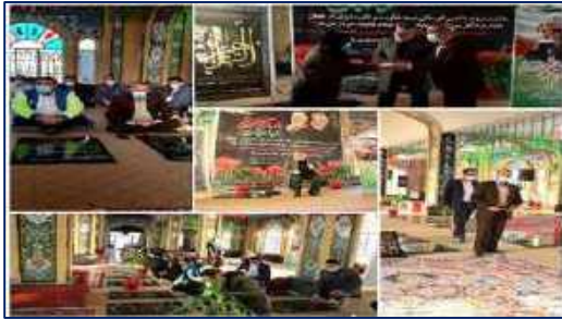
برگزاری مراسم تجدید بیعت با شهدا به مناسبت شهادت حضرت فاطمه (س) در شهرستان گرمسار ۱۴۰۰/۱۰/۱۴