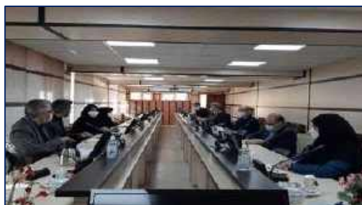
حضور معاونین تحقیقات و فناوری و آموزشی دانشگاه علوم پزشکی استان سمنان در دانشکده پرستاری و مامایی دانشگاه ۱۴۰۰/۱۰/۰۶