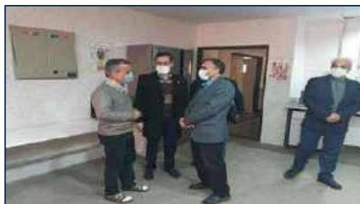
بازدید نماینده مردم شهرستان دامغان در مجلس شورای اسلامی از دانشکده بهداشت ۱۴۰۰/۱۰/۲۹