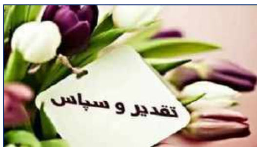
قدردانی بیماران از مدیرعامل و کادر درمان مرکز آموزشی، پژوهشی و درمانی کوثر ۱۴۰۰/۱۰/۲۵