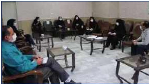
جلسه کمیته آموزش و کمیته ساماندهی رسانه های آموزشی در شبکه بهداشت و درمان دامغان ۱۴۰۰/۱۰/۰۵