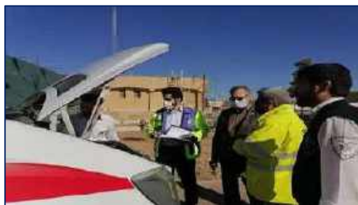
بازدید سرپرست اورژانس پیش بیمارستانی و مدیر حوادث دانشگاه از پایگاه های اورژانس پیش بیمارستانی شهرستان سمنان ۱۴۰۰/۱۰/۰۱