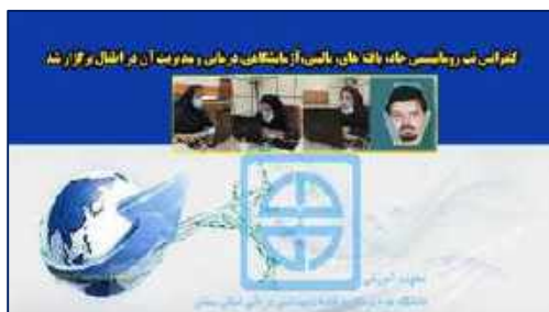
کنفرانس تب روماتیسمی حاد: یافته های بالینی، آزمایشگاهی، درمانی و مدیریت آن در اطفال برگزار شد ۱۴۰۰/۱۰/۰۱