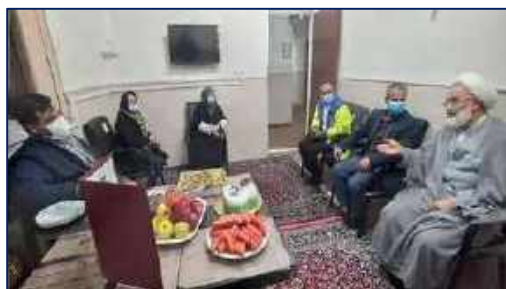
بازدید مسئولین شهرستان آرادان از مراکز بهداشتی درمانی این شهرستان ۱۴۰۰/۱۰/۰۱