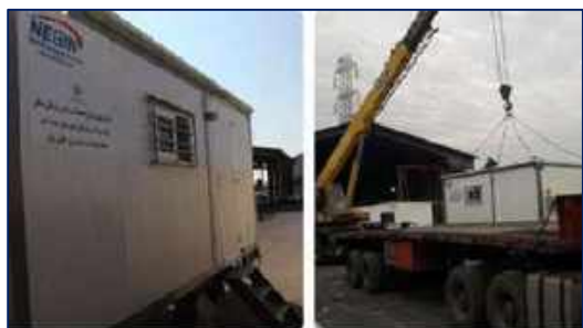
تحویل مرحله دوم کانکس خانه های بهداشت عشایری جاشلوبار شهرستان مهدیشهر و رامه پایین شهرستان آرادان ۱۴۰۰/۱۰/۱۲