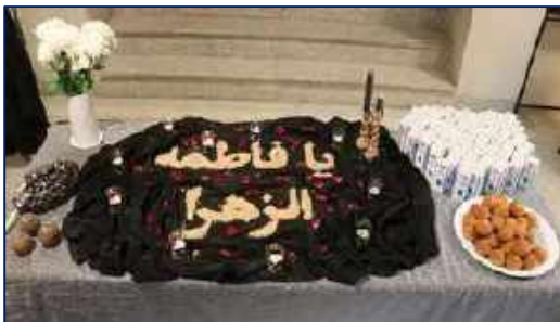
مراسم گرامیداشت شهادت حضرت فاطمه زهرا (س) در ستاد مرکزی دانشگاه ۱۴۰۰/۱۰/۱۵