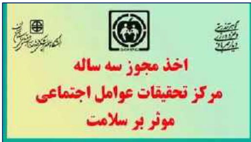
اخذ مجوز سه ساله مركز تحقيقات عوامل اجتماعي مؤثر بر سلامت ۱۴۰۰/۱۰/۱۴